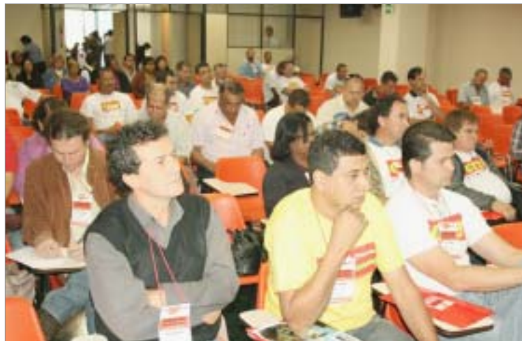
Sindicalistas definiram pela elaboração de um plano de luta