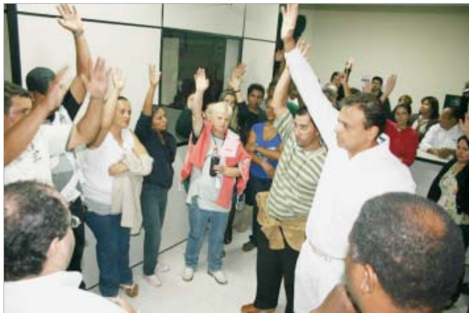
...ao final, aprovaram a proposta de reajuste de 6,30%

O s servidores municipais de Guatapar aprovaram em assembleia geral, no dia 31 de maio, a proposta de reajuste salarial de 6,30% apresentada pela prefeitura. Depois de 30 dias de negocia os servidores de Guatapar saíram vitoriosos da primeira data base no municpio. A oferta da prefeitura foi colocada em vota e aprovada pela maioria dos servidores que participaram da assembleia realizada na sede do Sindicato. Alm do reajuste salarial de 6,30%, referente a infla, tambm foi concedido aos trabalhadores de Guatapar um aumento de 25% no vale alimenta, que passa de R$ 80 para R$ 100. Sobre o vale alimenta ainda ficou acordado com o prefeito que no ms de outubro deste ano haver um novo aumento e o be-