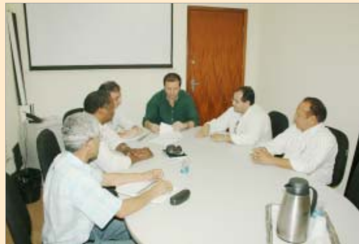
Diretorias do Sindicato e do Daerp durante assinatura de documento que garante pagamento da hora extra

Essa extensão de pagamento já está valendo a partir de 1º de Junho de 2011.