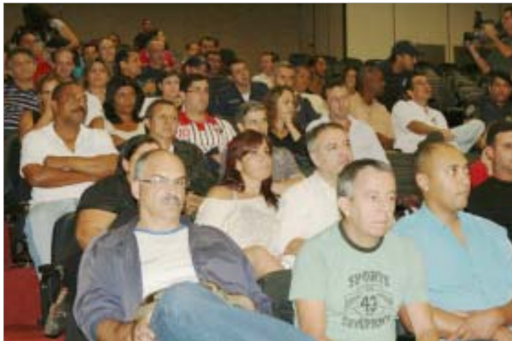
GCMs acompanharam a votação e aprovação do projeto na Câmara de Vereadores

“A redução da jornada de trabalho dos GCMs de 40 para 36 horas semanais era uma reivindicação histórica do Sindicato e da categoria. Felizmente nosso pedido foi aceito pela administração municipal, que entendeu a necessidade de mudar a jornada, sem reduzir os salários. Essa conquista representa melhor qualidade de vida para os servidores e