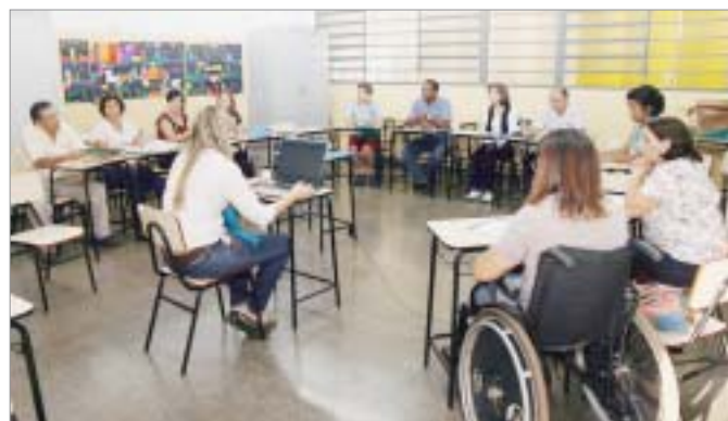
Movimentos Sociais procuraram marcar presença e promover o debate

30 de novembro a 4 de dezembro 14ª Conferência Nacional de Saúde