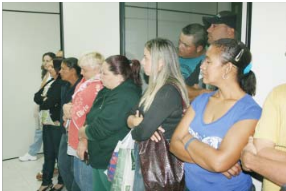
Dezenas de trabalhadores foram  assembleia...