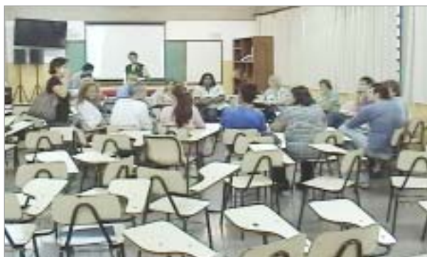
Sobraram lugares nas pré-conferências e o governo não apareceu de forma efetiva