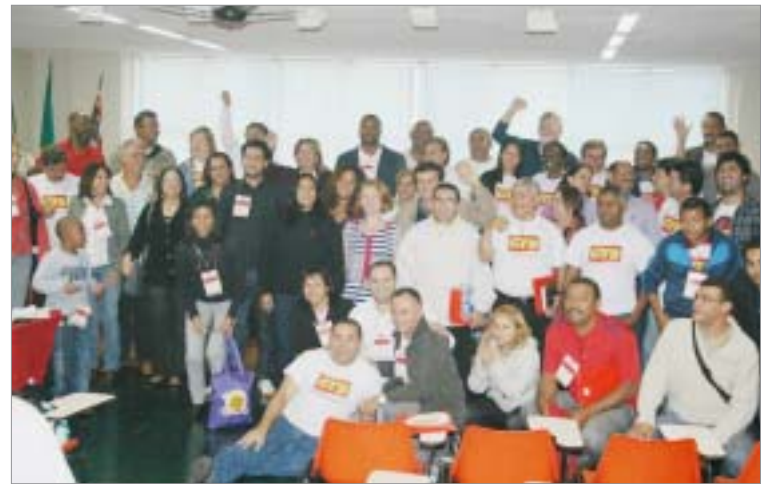
Dezenas de sindicalistas de várias regiões do Estado participaram do evento

A CTB se encontra diante de uma nova etapa e novos