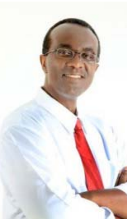
Por André Luiz da Silva

S er servidor público não é fácil. O servidor é vítima constante do preconceito da população em geral, da crítica contumaz de setores da imprensa e do des-caso do poder público. Foi-se o tempo em que os pais sonhavam com os filhos ingressando no serviço público como forma de status. Hoje, alguns desavisados buscam as carreiras públicas pelo salário, outros pela suposta estabilidade. Não é tão simples assim.