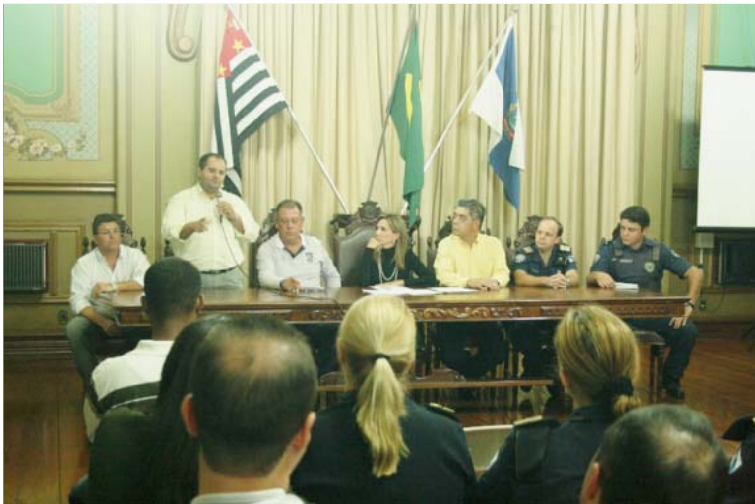
Projeto foi anunciado pela prefeita após luta e assembléias dos trabalhadores

Prefeitura apresentou projeto e Câmara aprovou lei que reduz a carga horária dos GCMs de 40 para 36 horas semanais