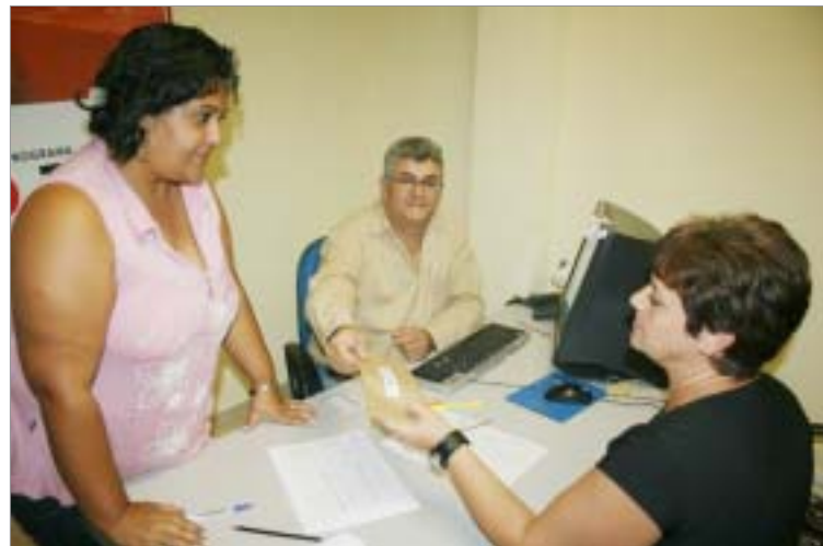
Atendimento  feito na sede do Sindicato